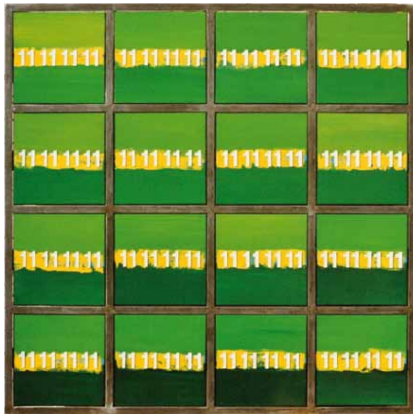
„Numerischer Horizont“, 1998, Öl auf Leinwand, 134 x 134 cm, 16 Tafeln à 30 x 30 cm in Stahlrahmen