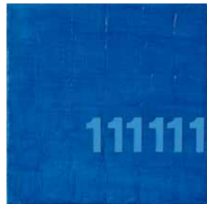
„Numerische Reihe“, 2007, Öl auf Leinwand, 30 x 30 cm