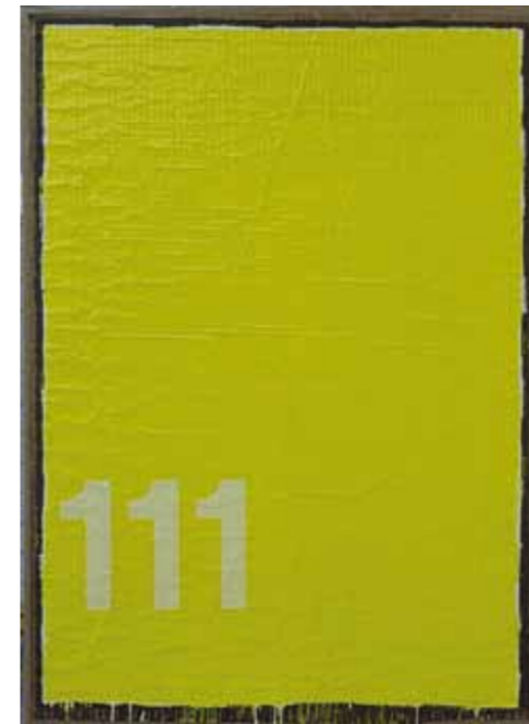
„Feld mit numerischen Elementen“, 2005, Öl auf Ölpapier und Leinwand, 140 x 103 cm

Ausstellungsleiter des Mannheimer Kunstvereins