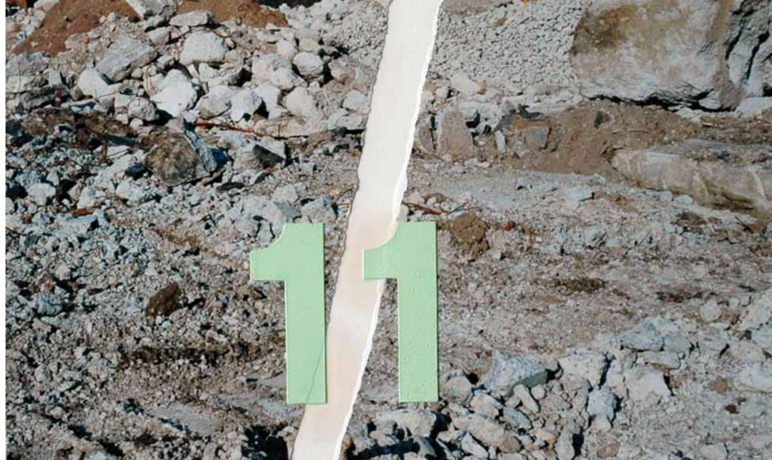
„Riss“, 2001, Öl auf Foto und Papier, 29,7 x 42 cm