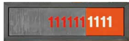
„Numerisches Objekt“, 1998, Öl auf Blei und Leinwand, 18,5 x 60,5 cm mit Stahlrahmen, Auflage 11